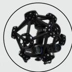
也适配 MetraSCAN 3D