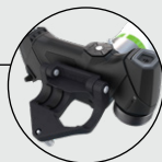
快拆设计: 从自动化模式切换到手持模式